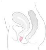
リリーカップ™ ワン

折り畳んだ状態のカップを指でしっかりと押さえ、リング部分を下にして挿入します。きちんと持たないと、挿入する前にカップが開いてしまいます。カップを指で押さえながら、もう片方の手で陰唇を開き、ゆっくりとカップを挿入します。